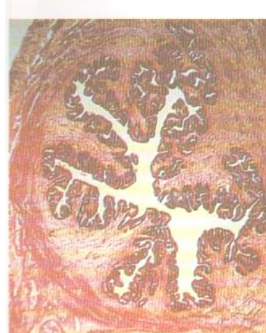
2.93 – Corte transversal do útero em fase secretora