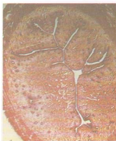
2.92 – Corte transversal do útero em fase proliferativa